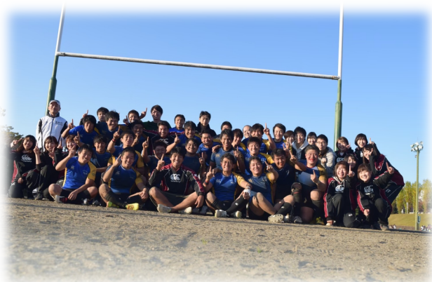
医学部ラグビー部の皆さん

基本的に部活動メインの生活をしているので両立できているのか分かりません(笑)ただ一つ言えることとして、メンタル面は特に大事にしています。特にラグビーで培った最後まで諦めずに全力を尽くす精神は学業においても大きく役立っていると思います。また部活動で築いた縦の繋がりが勉強の役に立つこともあります。大学での勉強は高校までと違い自ら学びに行かなければならないのでこのような交流も大事にしたいと思っています。