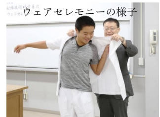
ウェアセレモニーの様子

週4日主に大学病院で行いました。(たまに外部の病院、2週～4週ほど)週ごとにX線写真(レントゲン)、CT、MRI、放射線治療などといった各部門をまわり、放射線技師が実際の医療現場でどのような仕事をしているか学びました。