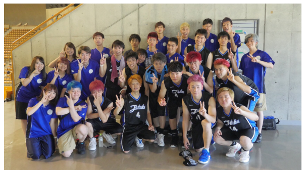
医学部バスケット部の皆さん