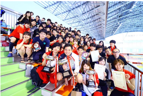
医学部 水泳部の皆さん

自分は幼稚園の頃に水泳を始め水泳が大好きです。だから本試験で必ず合格し練習時間を削らないことをモチベーションとして勉強に取り組んでいます。また、疲れた時は泳いだり友人とお酒を楽しんだりしてリフレッシュしています。メリハリのある生活をしてストレスと上手く付き合いきちんと自己管理できるように心がけています。