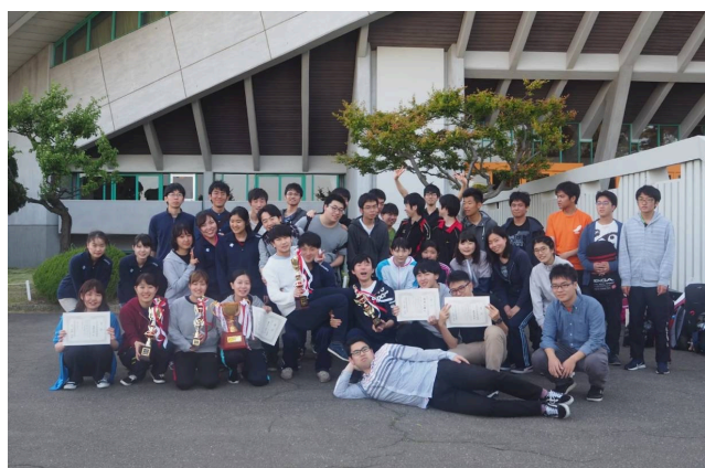
医学部卓球部の皆さん