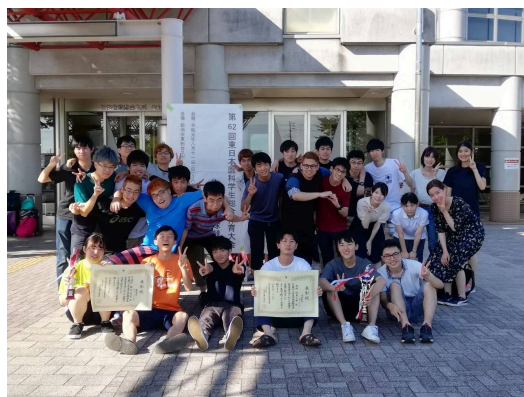
第62回医科学生総合体育大会にて